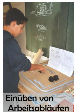
Einüben von Arbeitsabläufen