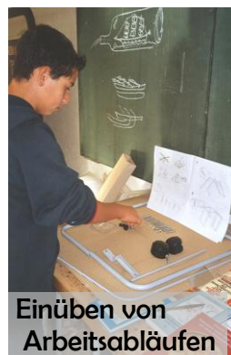
Einüben von Arbeitsabläufen